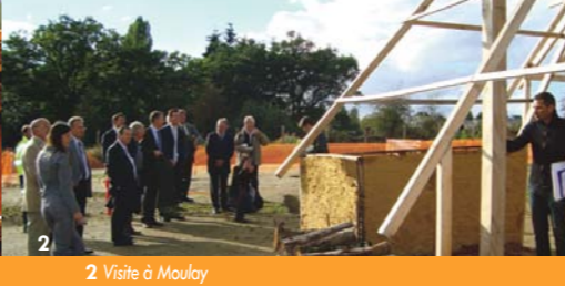
2 Visite à Moulay