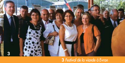
3 Festival de la viande à Evron