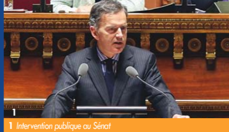
1 Intervention publique au Sénat