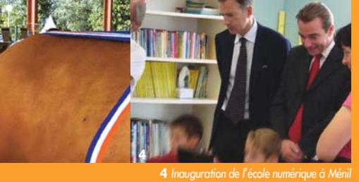
4 Inauguration de l'école numérique à Ménil