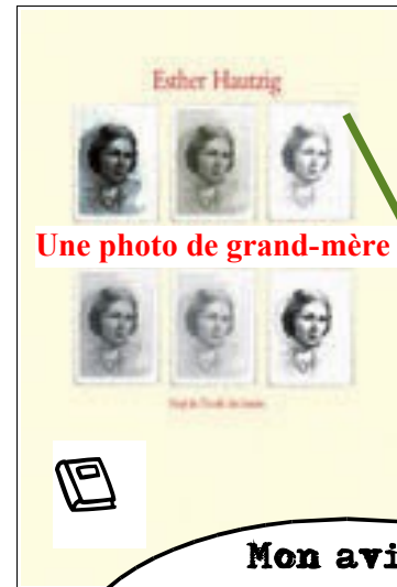
Une photo de grand-mère

- Qui ose, demanda-t-il d'une voix enrouée, aux courtisans debout près de lui, qui ose nous insulter par cette ironie blasphématoire ? Emparez-vous de lui, et démasquez-le, que nous sachions qui nous aurons à pendre aux créneaux, au lever du soleil.