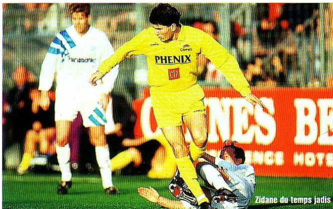
Zidane du temps jadis